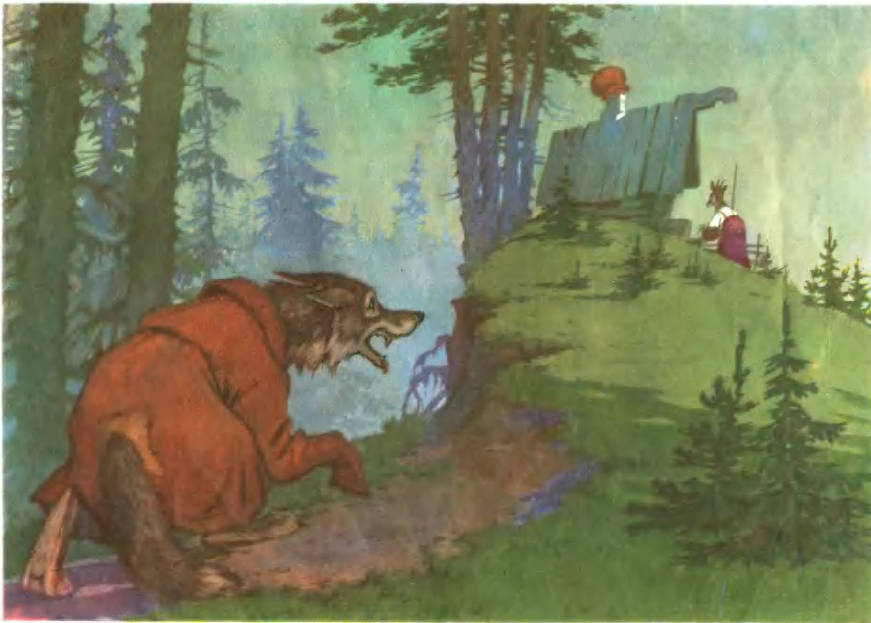
Подслушал козу волк